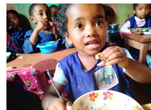
Saint Jean Baptiste

Dans une cuisine que nous avons financée, les parents d'élèves préparent chaque jour les repas qui seront distribués à midi.